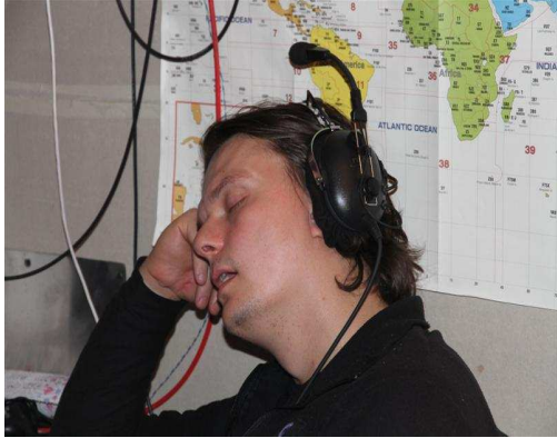
E77DX, duboka koncentracija, Ili san o pile up W6/7 na 160m ?

stvarno mozemo i da uradimo i doslovno - druzimo se... Dovoljni obroci sna i odmora i vec smo u nedjelju ujutro.