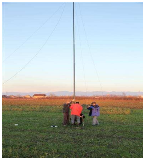
Udaljena RX antena...

Prvi dan završavamo sa 3K3 veza , ulazimo u drugu noc. Na zalost konstatujemo da je 4 sq na 80 otkazao poslusnost, tako da kao drugu antenu na tom bandu i antenu iznad 3550khz koristimo Titanex vetical, ali tada na 160m ostajemo samo sa 4 sq koji su vise nego dovoljni za mults i kratkotrajni run ..