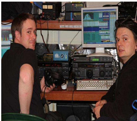
Mult 1, DK4YJ i E77DX..

Nesto brojniji tim dozvoljava rad u grupama, tako da su na run stanici uvijek dvojica, a na mult stanicama imamo uvijek bar po jednog, a nerijetko i dvojicu. Multiplieri se vrijedno skupljaju, bar nesto ide kako treba. Davno smo naucili da multiplier stanica ne treba da zaostaje ni u kom pogledu za run, ovaj puta smo je cak i pojacali skimmerom i kao sto Zoka u jednom momentu rece da se isplati svaki euro koji je u njega ulozen. Bilo bi dobro imati skimmer i na drugoj mult stanici, a sigurno da bi i na runu nebi skodio.