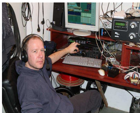
Mult 2, DK9TN..

Kao sto rekoh veliki broj ljudi omogucio je i druzenje, nesto kao na velikim skupovima rad po plenumima, tako da je i ljubazno osoblje u pizceriji Napoli primijetilo da dolazimo u grupama. Druzenje, to je ono na sto svi mislimo kada se spomene contest u kategoriji vise operatora, ali ovo je prvi puta da to