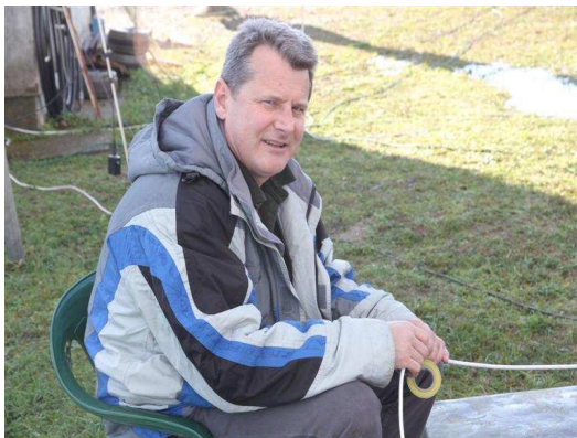
E74AW ,domacin u svakom pogledu...