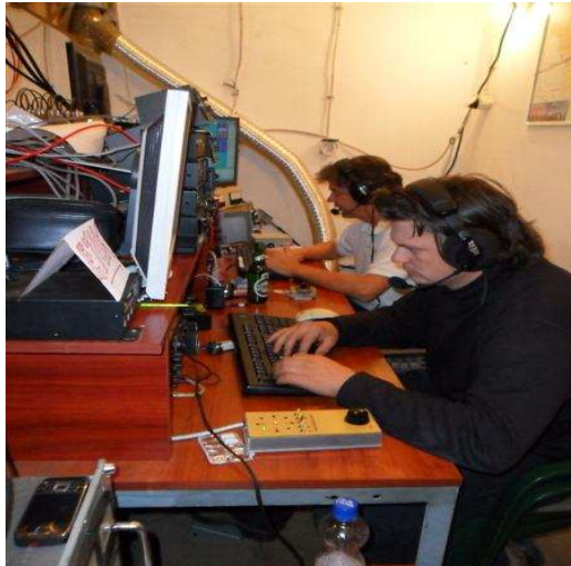
RUN: 9A5K i E77DX