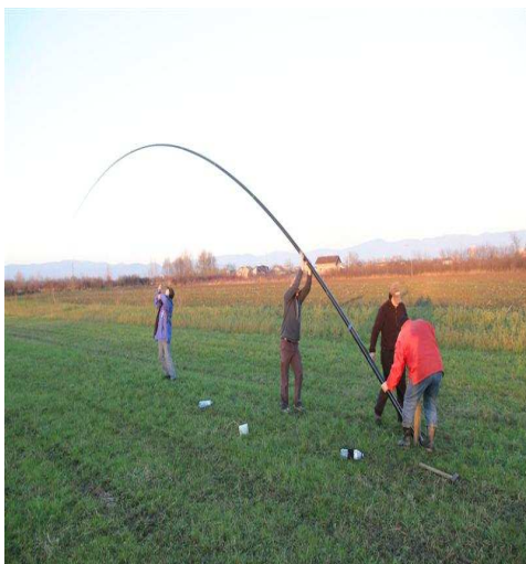
Podizanje Spiderbeam 18m fiberglass pole -