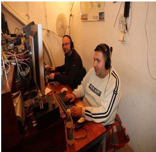
RUN: kumovi u akciji, E77E i E76C