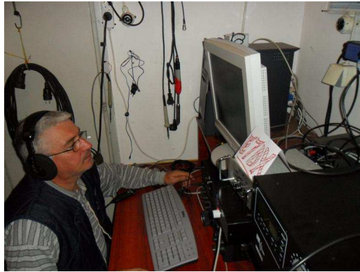
E70R, neumorno preslusava bandove, svaki multiplier je vazan...

Broj veza je zadovoljavajuci kao i mults, a Ruse stizemo, ali Slovaci nam jos bjeze , toliko da polako postajemo svjesni da su nam nedostizni. Naravno to ne znaci da smo se predali , naprotiv, ako nas vec uzimaju neka to bude sto manja razlika i jos jace pocinjemo da kopamo po mults , koji iz sata u sat raste , ako nista imamo vise mults od njih, cak smo i razliku u vezama smanjili , ali sa bodovima to nesto traljavo ide.