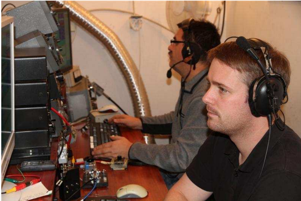
RUN: DK4JY i E70T

Nesto brojniji tim dozvoljava rad u grupama, tako da su na run stanici uvijek dvojica, a na mult stanicama imamo uvijek bar po jednog, a nerijetko i dvojicu. Multiplieri se vrijedno skupljaju, bar nesto ide kako treba. Davno smo naucili da multiplier stanica ne treba da zaostaje ni u kom pogledu za run, ovaj puta smo je cak i pojacali skimmerom i kao sto Zoka u jednom momentu rece da se isplati svaki euro koji je u njega ulozen. Bilo bi dobro imati skimmer i na drugoj mult stanici, a sigurno da bi i na runu nebi skodio.